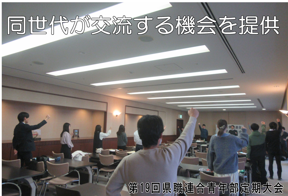
第19回県職連合青年部定期大会