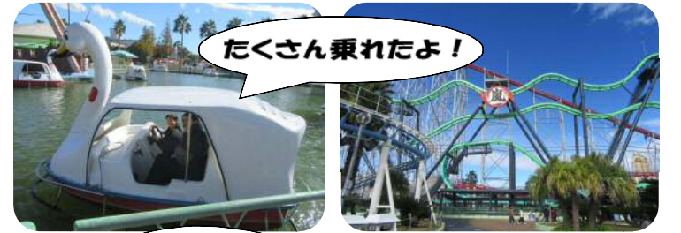
たくさん乗れたよ!

病院レクに参加して みんなでバスにのってながしまスパランドへいきました。バスで「レク」をして、けいひんがあたりました。ほくはのりものにたくさん乗りました。いちばんたのしかったのはかえるのびよんびよんじゃんぶです。おともだちもなんかいいものがありました。またみんなでいきたいと思います。