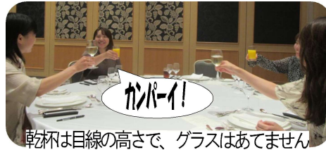
乾杯は目線の高さで、グラスはあてません