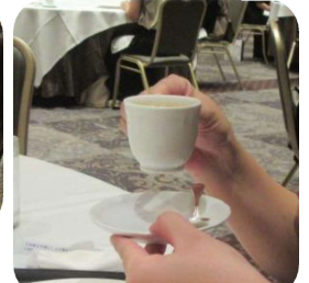
コーヒーはお皿も一緒に持ちます