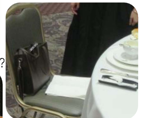
会食中、席を離れるときは?