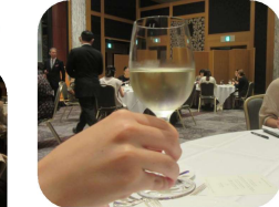
ワイングラスの持ち方はこんな感じ?