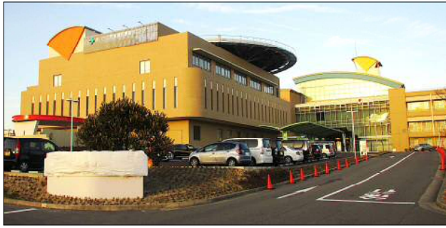
小児センター外観

2月1日小児センターは三次救急を開始しました。愛知県屈指の小児医療として期待が高まっています。しかし、欠員状況が続く中で人材が育ち、担っていくのでしょいか・・・。