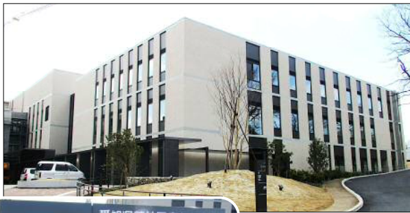
精神医療センター外観

城山病院は、前期工事が終了し、医療観察法病棟・西病棟（救急・急性期・回復期リハビリテーション）・診療管理棟が完成しました。それに伴い、2月22日に「愛知県精神医療センター」と名称を変更しました。児童精神科など、新しい役割を担って、地域から信頼されるセンターとして期待されています。