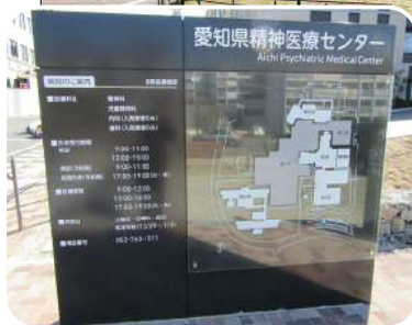
新しいセンターの看板

城山病院は、前期工事が終了し、医療観察法病棟・西病棟（救急・急性期・回復期リハビリテーション）・診療管理棟が完成しました。それに伴い、2月22日に「愛知県精神医療センター」と名称を変更しました。児童精神科など、新しい役割を担って、地域から信頼されるセンターとして期待されています。