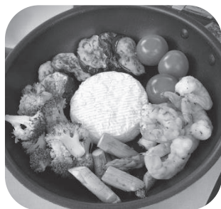
まるごと! チーズフォンデュ