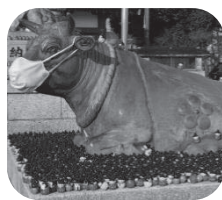
コロナ対策は万全です!!