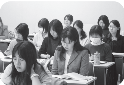
熱心に話を聞く女性組合員

の低さをあまり感じることもなく仕事ができるのは、過去に声をあげ慣習や制度を改善していった先輩方がいたからです。今もまだ人事評価の陰で男女の差があるように感じます。このような隠れた問題を見える化し、女性部全体で声をあげていく必要があります。今後も女性部の活動に協力と理解をお願いします。