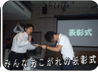
みんなあこがれの表彰式