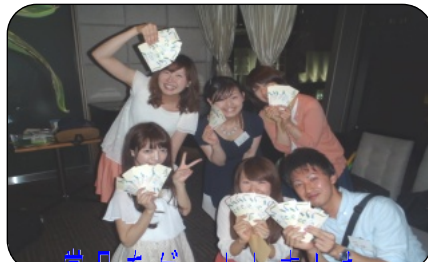
賞品をゲットしました。