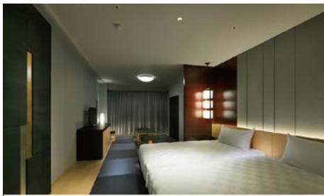
本館リニューアルルーム