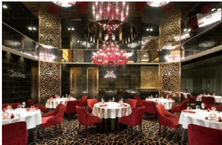
中国料理 翠陽(本館 B1F)