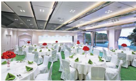
コンベンションホール シーポート(本館 B1F)