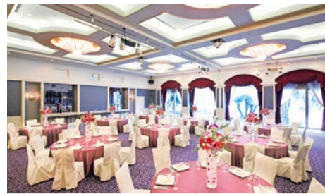
コンベンションホール マリンポート(アネックス1F)