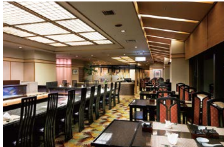
生簀割烹 海幸(アネックス2F)