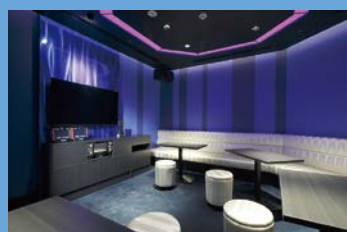
ミュージックルーム

ここに湧き出る天然温泉は、豊富な成分を含み、“療養泉”として認められるほど恵まれた泉質です。テルメゾンの温泉は「炭酸水素塩泉(重曹泉)・塩化物温泉」です。炭酸水素塩泉は“冷えの湯”ともいわれ、入浴後に清涼感があるのも特徴ですから、湯あたりしにくいという点でも美容向きの温泉です。