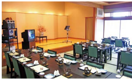
和風宴会場 白帆(アネックス別館)