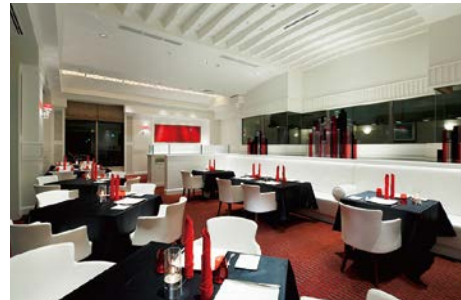
イタリア料理 アラゴスタ(アネックス1F)