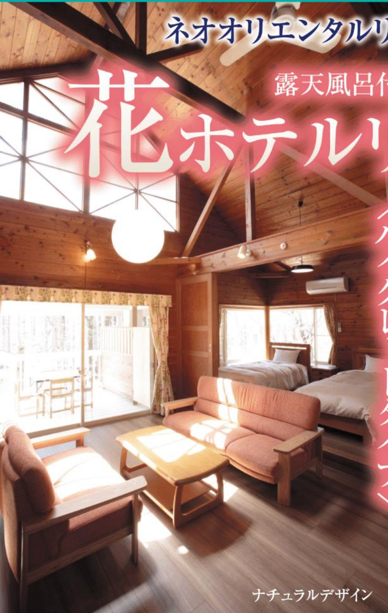
ナチュラルデザイン