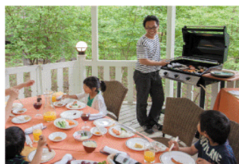
グレードアッププラン(期間限定テラスBBQ)