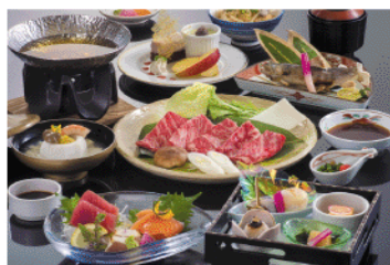
通常プラン(和食一例)

※お一人様/消費税・サービス料込 ※ご宿泊日によっては販売期間外となるプランがございます。