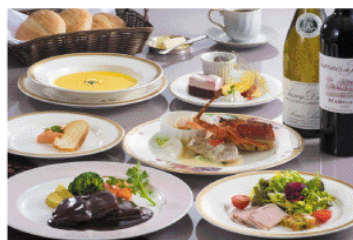
グレードアッププラン(洋食一例)