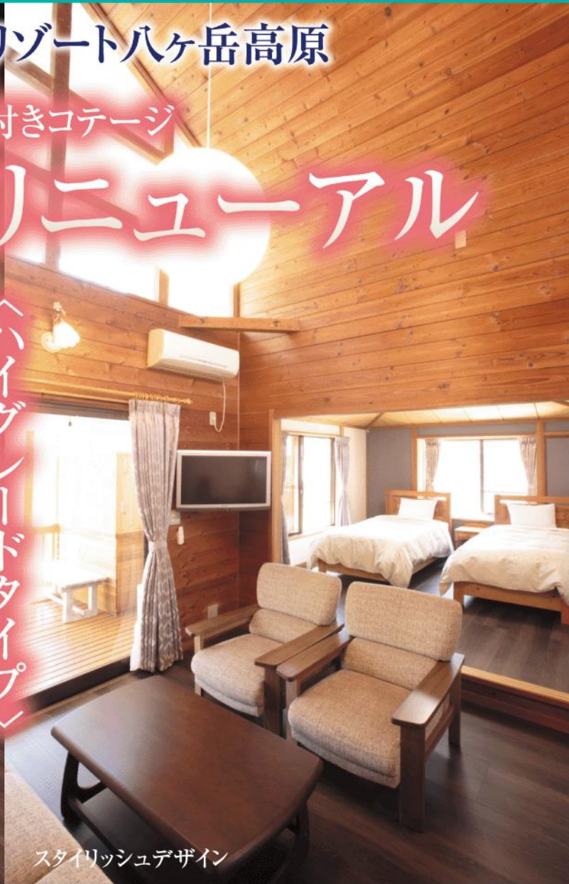
スタイリッシュデザイン

リビングやベッドルームは清潔感のあるフローリングに。 壁のクロスやソファセット、ベッドカバーやカーテンなども入れ替えました。