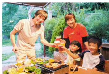
通常プラン(期間限定BBQバイキング)