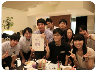
夏季レク(交流パーティー)